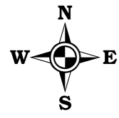
ЧЕРТЁЖ ПЛАНИРОВКИ ТЕРРИТОРИИ М 1:1000