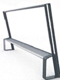
Внешний вид и пример использования велопоручня

2. Велостелла с тур-веломаршрутами и парковкой представляет собой конструкцию с картой, на которой изображаются тур-веломаршруты, доступные для проезда в той или иной части городского округа «Город Южно-Сахалинск».