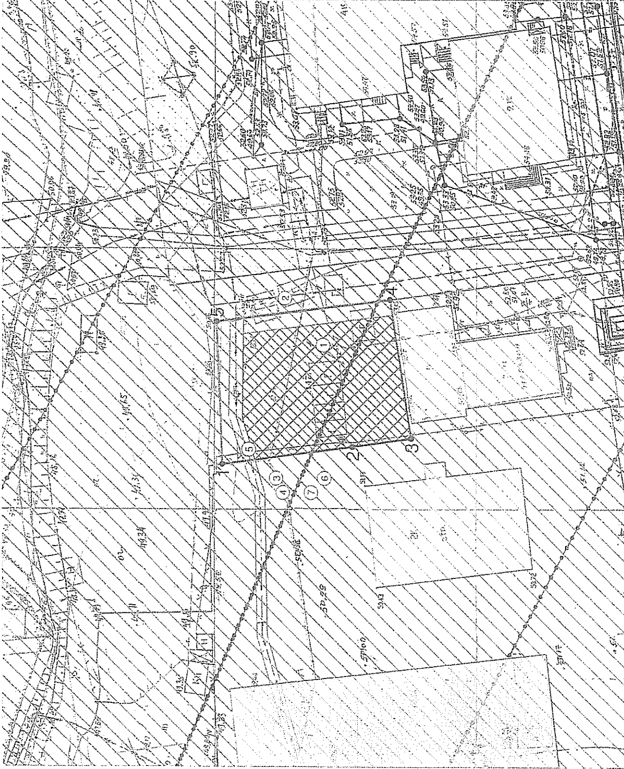
Чертеж градостроительного плана земельного участка разработки на топографической основе, выполненной