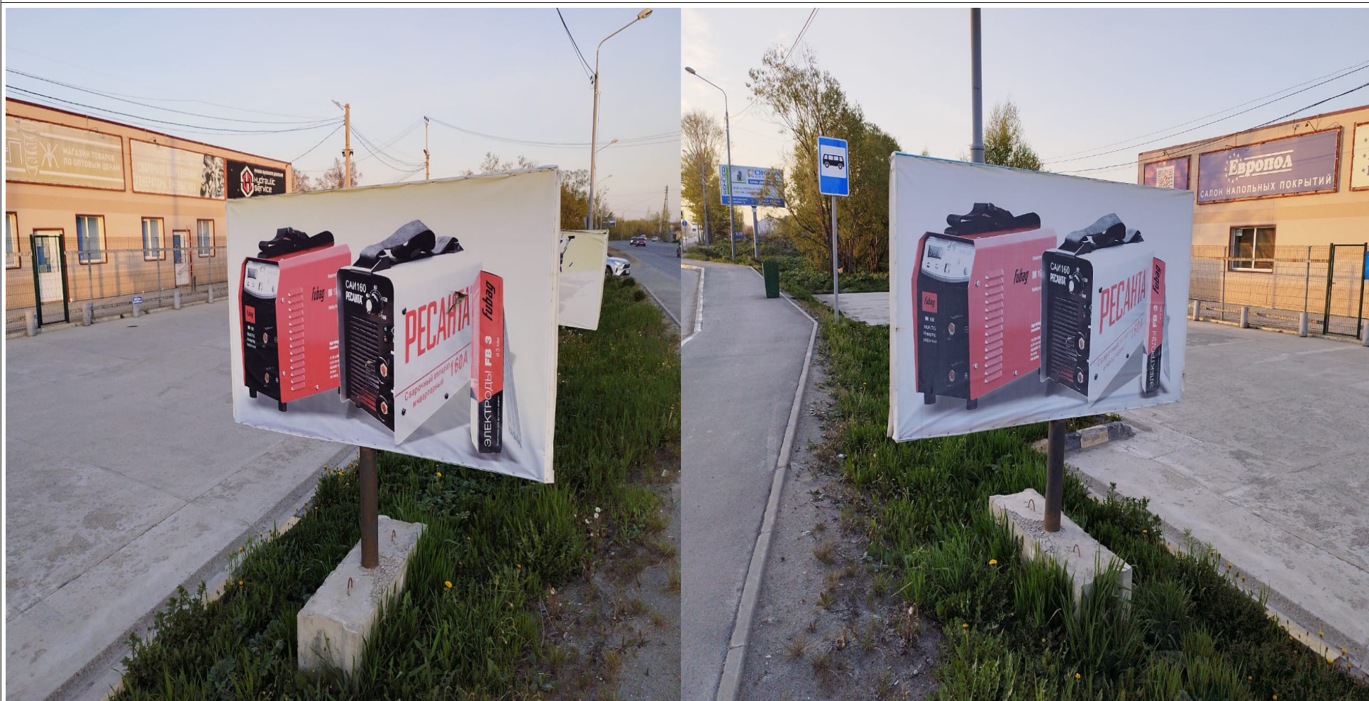
1. г. Южно-Сахалинск, восточная сторона ул. Холмская, западнее д. 73/2 Тип РК: Отдельно стоящая РК. Вид РК: Неустановленного вида.