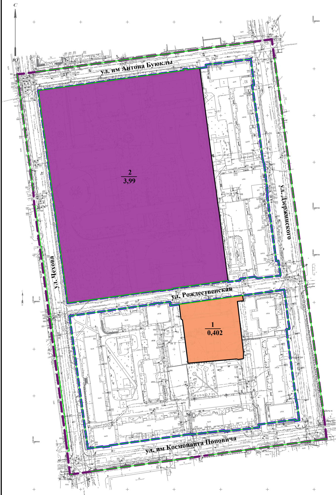
Схема элементов планировочной структуры