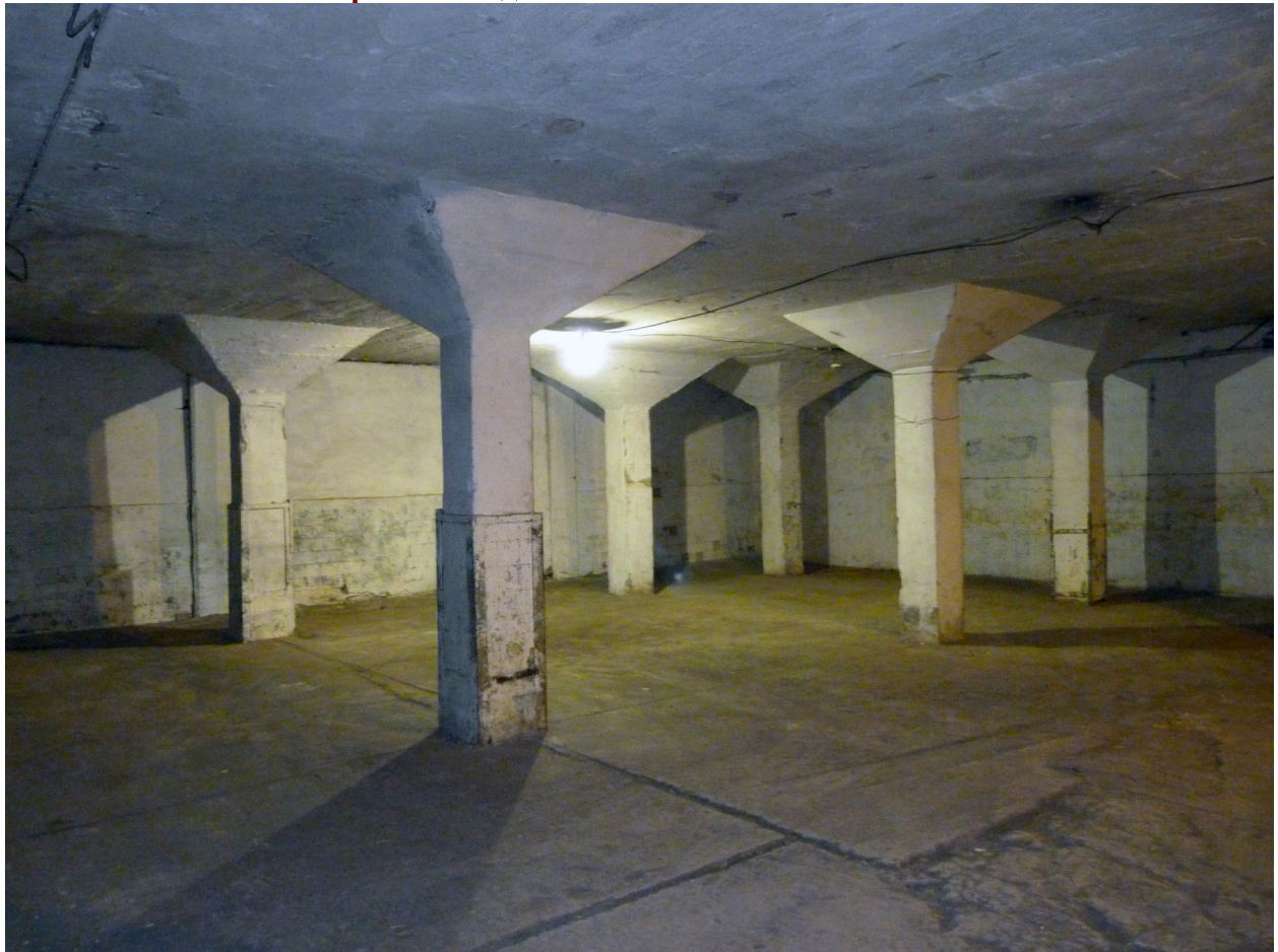
Заводские склады архитектуры 1930-х годов, интересны грибовидными капителями