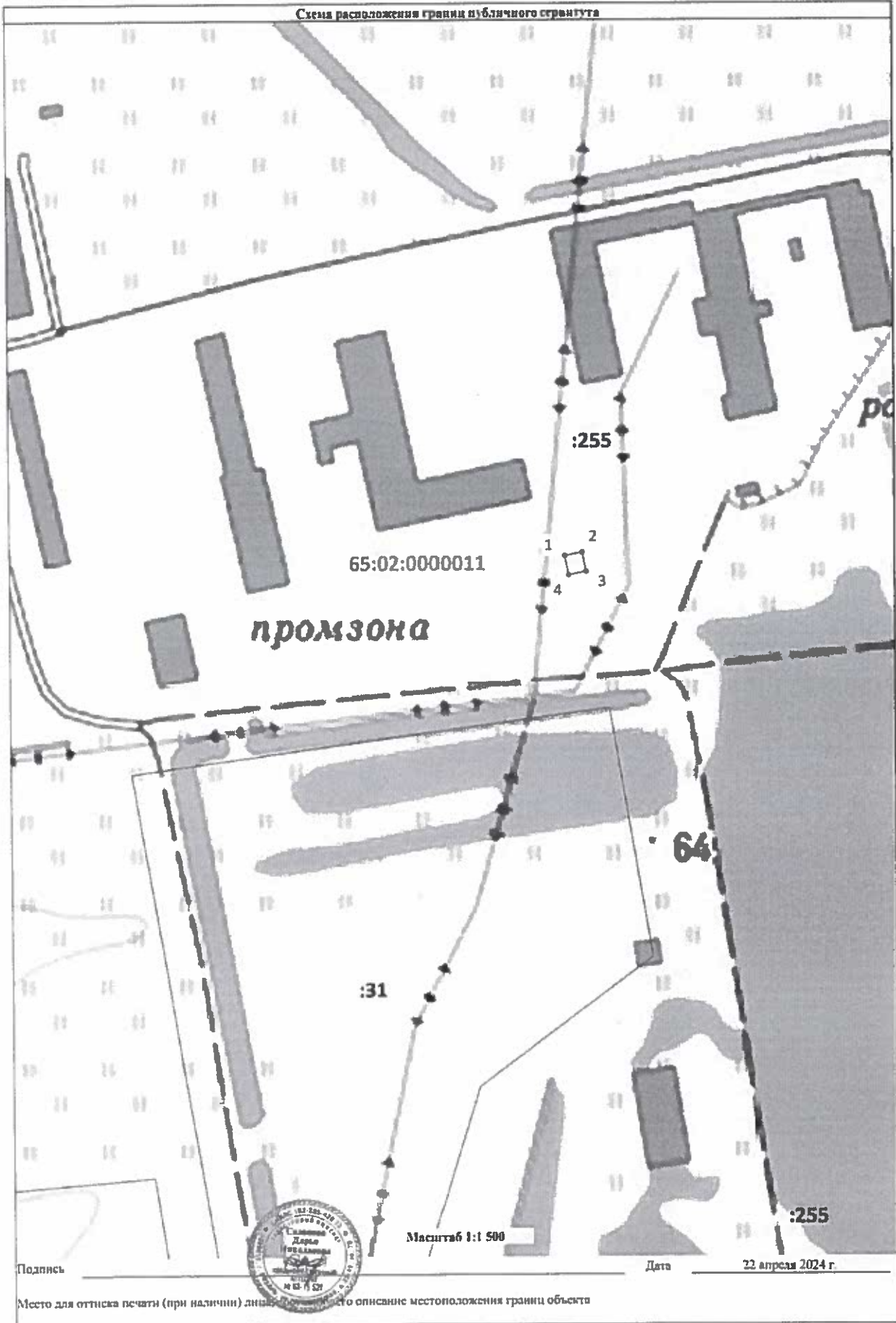
Схема расположения границ публичного округа