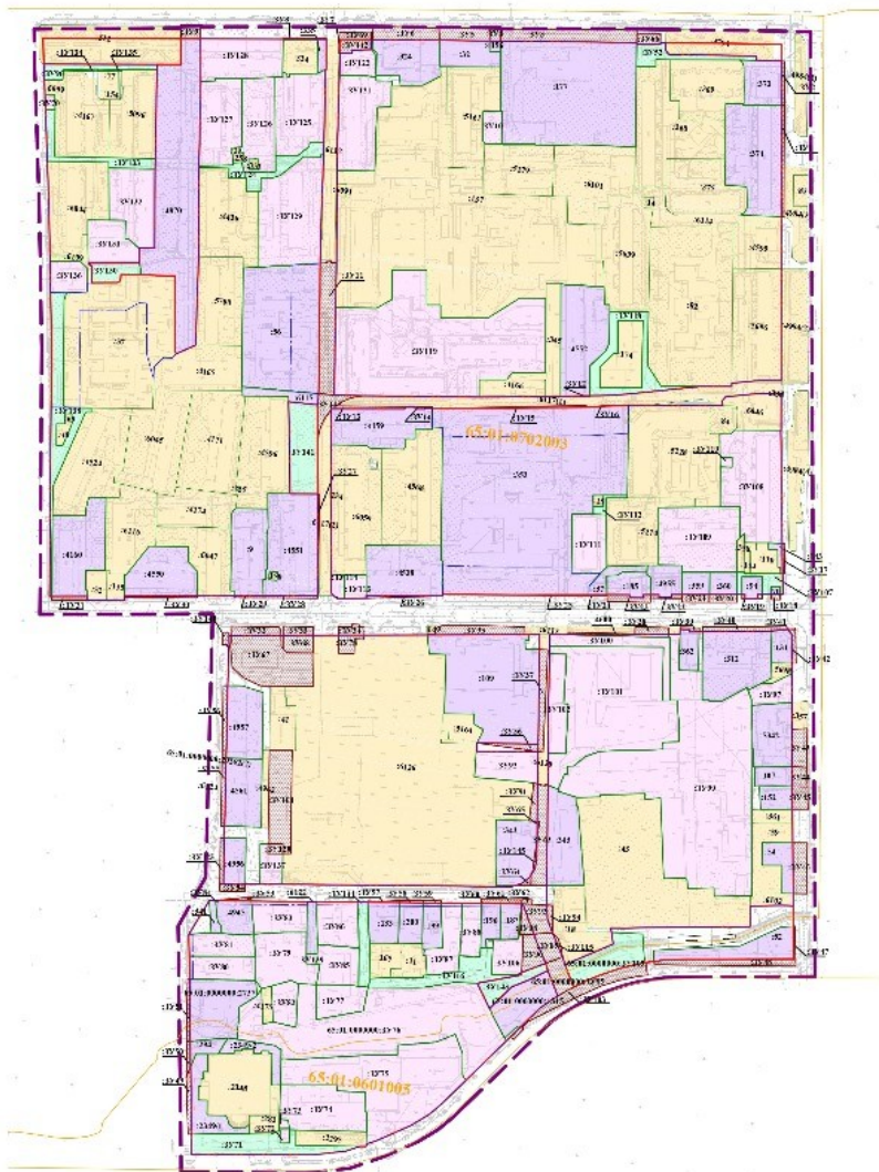
Схема типичной планировочной структуры