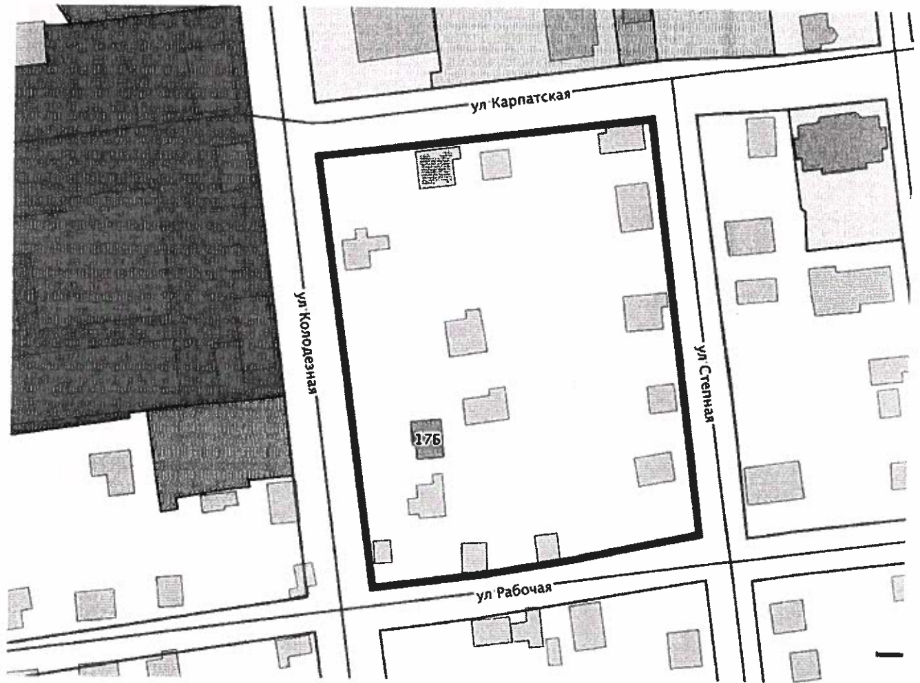
Схема границ проектируемой территории