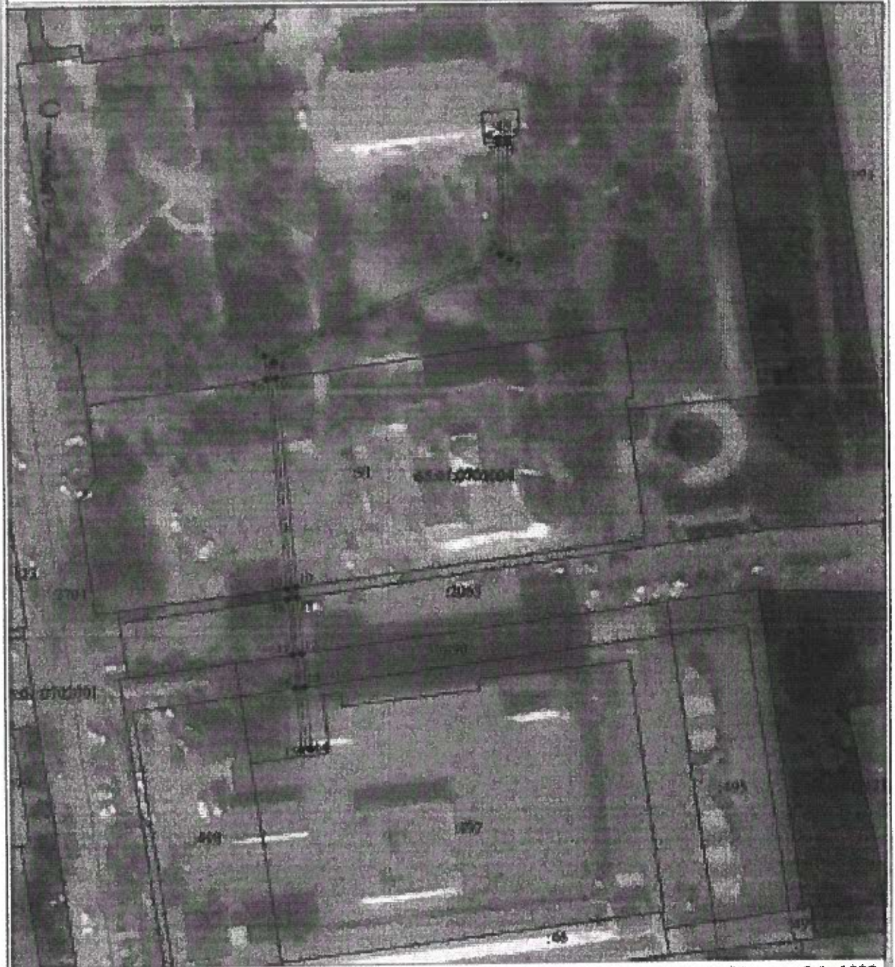
Схема расположения публичного сервитута