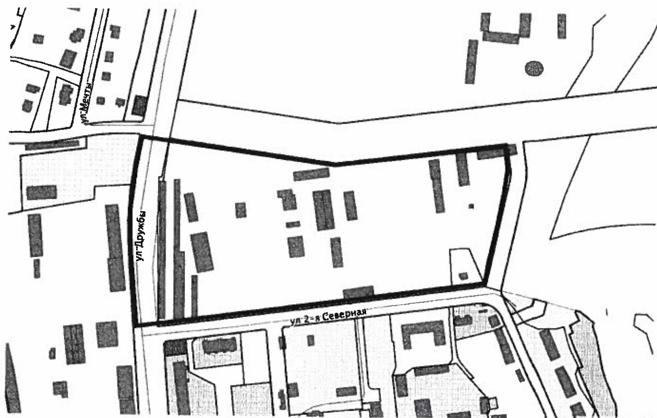
Схема границ проектируемой территории