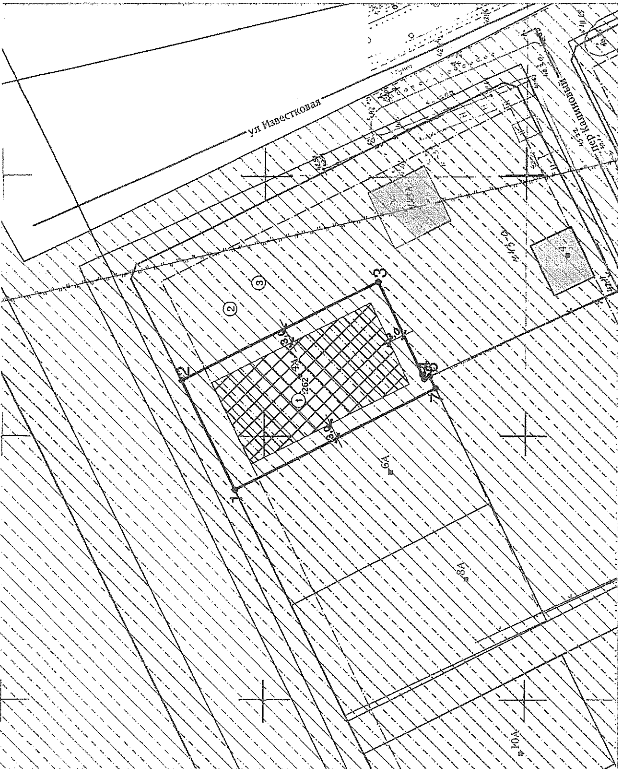
Чертеж градостроительного плана земельного участка разработан на топографической основе данных ГИСОД СО