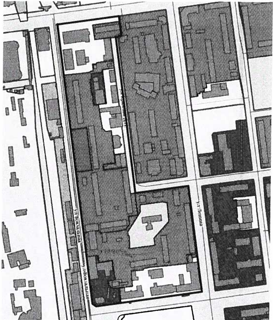
Схема границ проектируемой территории