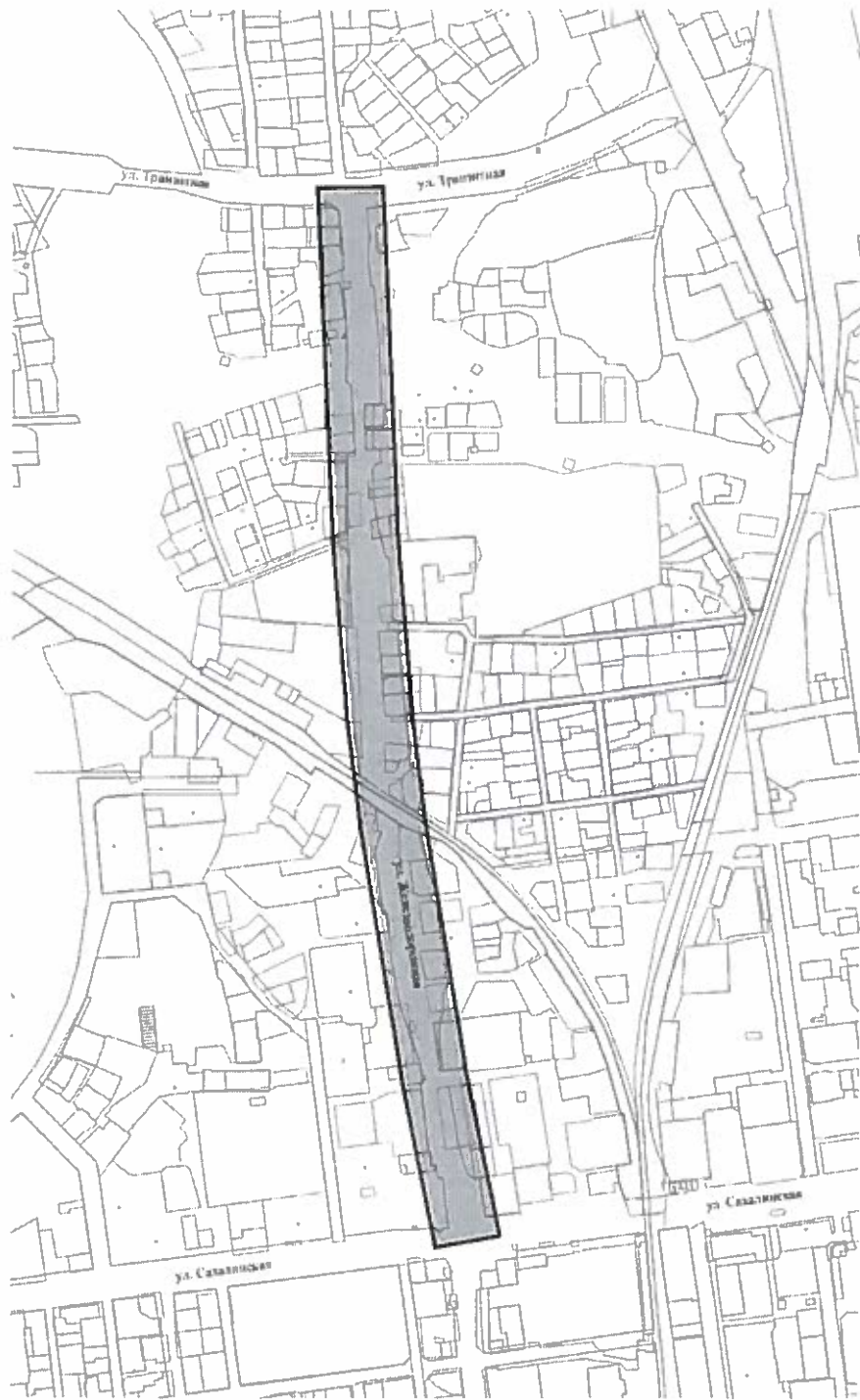
Схема границ проектируемой территории