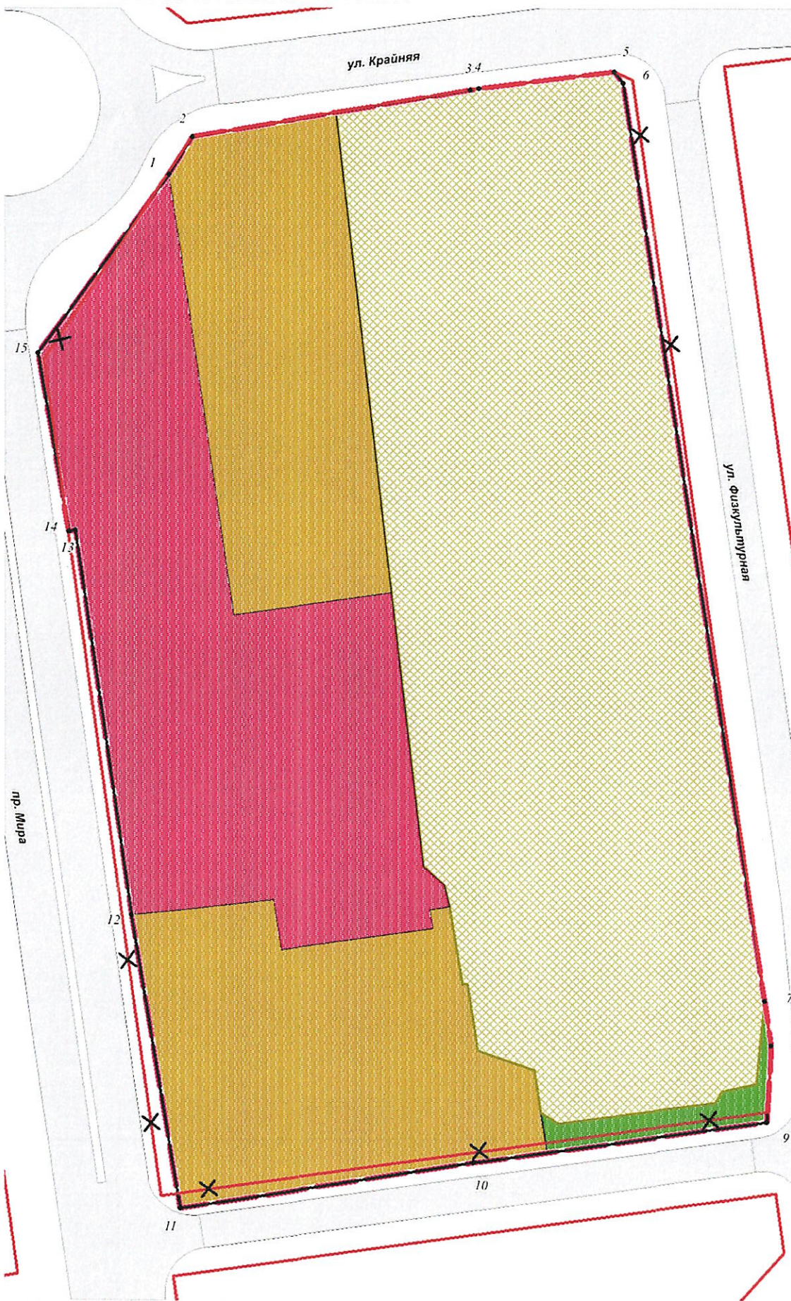
СХЕМА ЭЛЕМЕНТОВ ПЛАНИРОВОЧНОЙ СТРУКТУРЫ