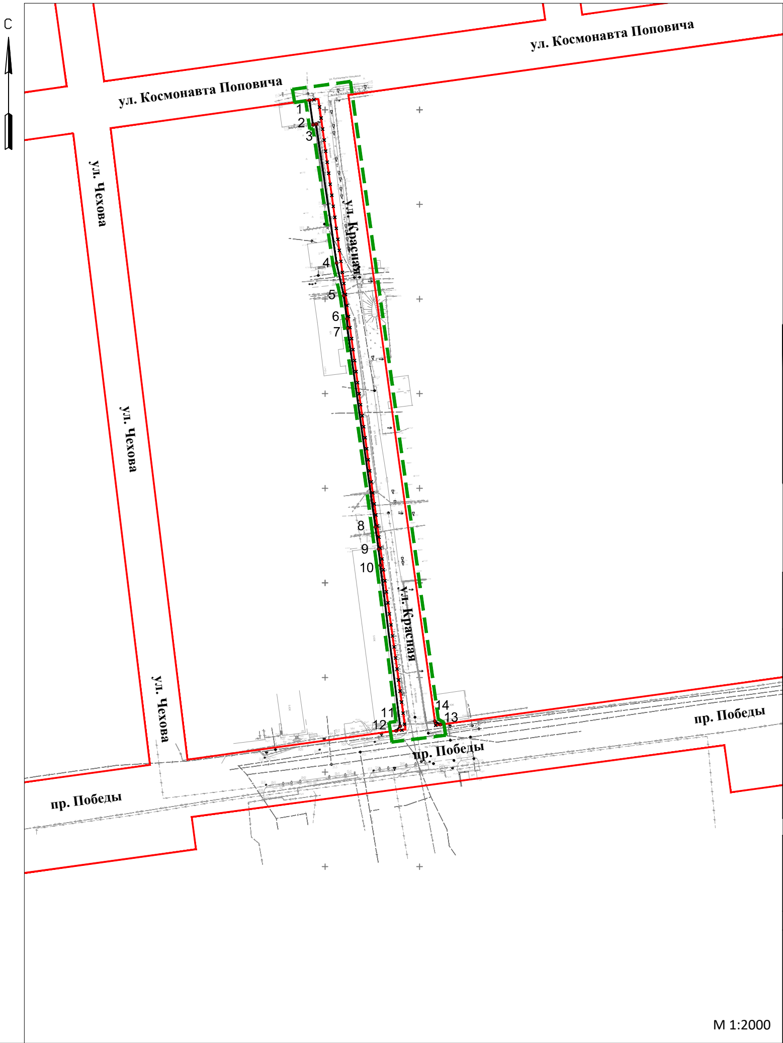
Перечень координат характерных точек красных линий