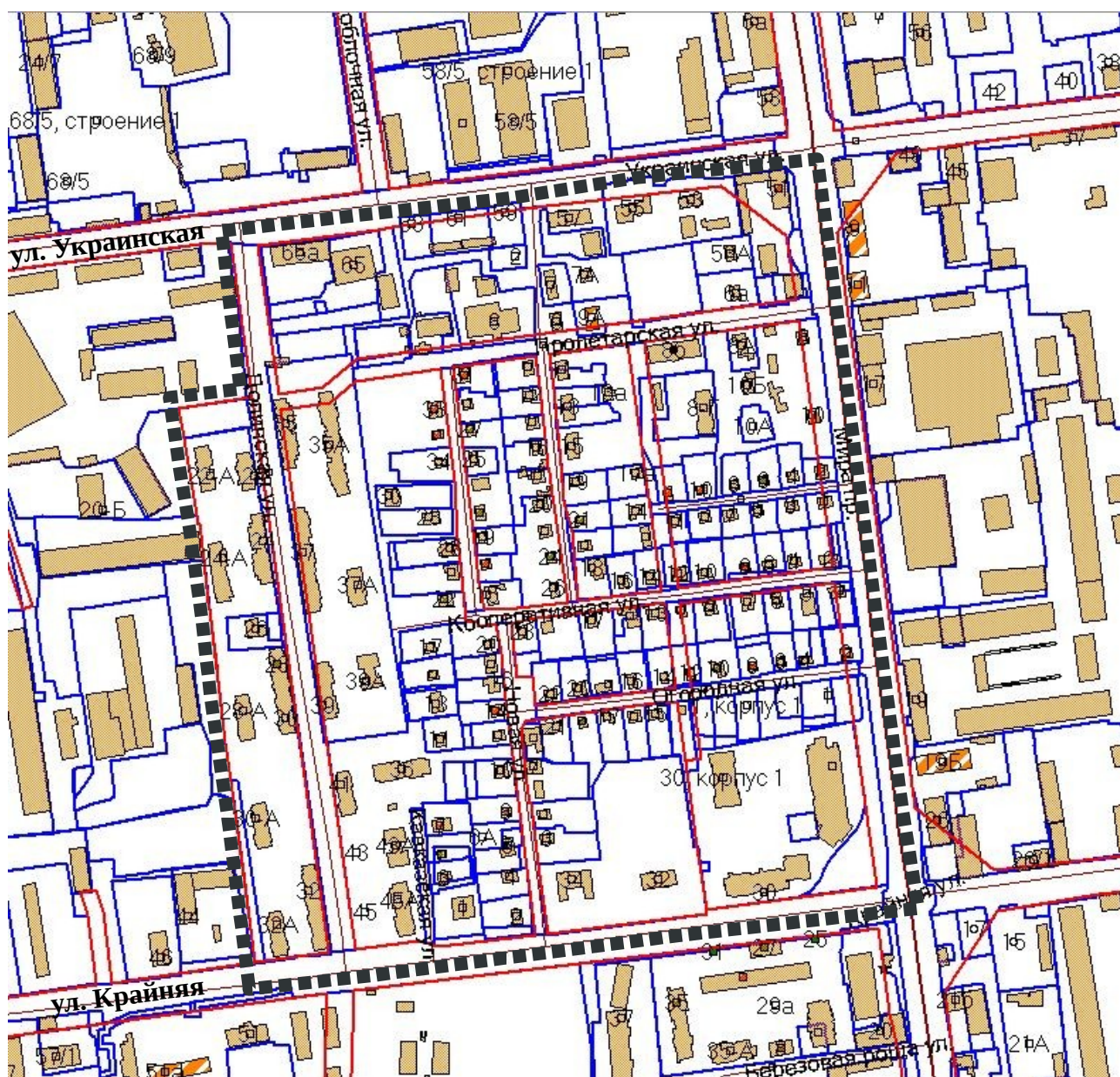
Схема границ территории проектирования

Схема расположения элемента планировочной структуры, микрорайона № 24, согласно проекту планировки с проектом межевания северного жилого района, утвержденного постановлением администрации города Южно-Сахалинска от 08.05.2013 № 746-па