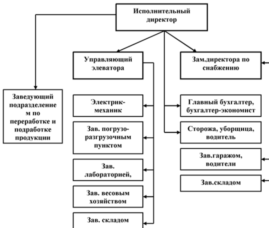
Рисунок 2 - Примерная организационно-управленческая структура исполнительной дирекции сельскохозяйственного потребительского снабженческо-сбытового кооператива

Деятельность каждой службы регламентируется должностной инструкцией, соответствующей требованиям внутреннего регламента кооператива. Кооператив отвечает по своим обязательствам всем принадлежащим ему имуществом и не отвечает по обязательствам членов кооператива. Убытки кооператива, полученные по вине члена кооператива, покрываются за его счет и в первую очередь возмещаются за счет паевого взноса этого члена. Члены кооператива несут солидарно субсидиарную ответственность по его обязательствам в пределах невнесенной части дополнительного взноса каждого из членов кооператива.