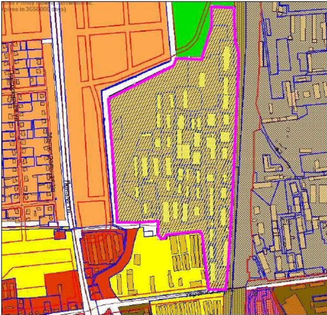
Схема границ проектирования территории