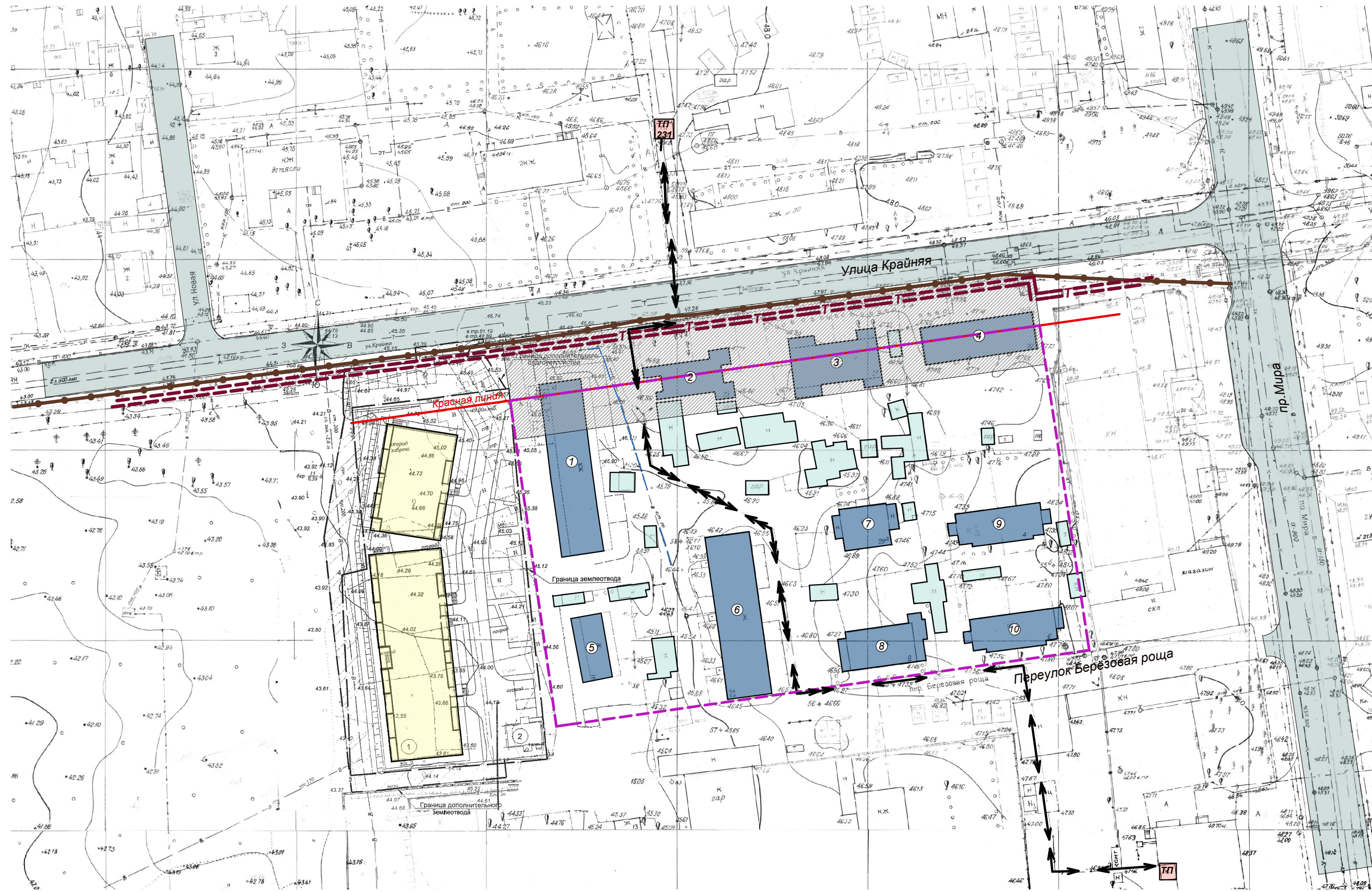
Схема использования территории в период подготовки проекта планировки территории М1:1000