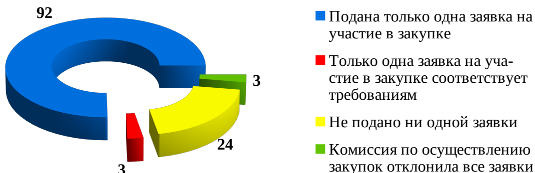
Причины признания процедуры определения поставщика (подрядчика, исполнителя) несостоявшейся, количество